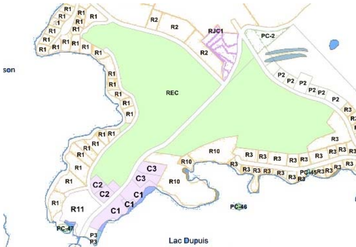
Illustration des zones concernées :